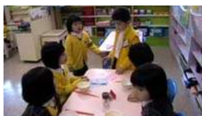
图 7：服务员在招待客人

顾客和收银员决定给餐馆起一个名字，他们也讨论了如何做点心的订单和记录单，下面这段对话是我在他们讨论餐馆名字时记录下来的比较典型的一段。