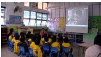
图 10：孩子们在观看电视节目

孙文立即补充说，他曾在教育频道上看过一个题为制作点心蒸笼的节目，于是教师们通过网络找到了这个节目，它解答了所有儿童的疑问，儿童们决定要按照节目中所展示的方法来制作自己的蒸笼。