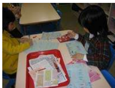
图 9：制作点心的订单卡片

这一活动似乎激起了孩子们参与的积极性，并且为他们提供了需要运用数学解决问题的技能的机会。下面是他们的问题之一：