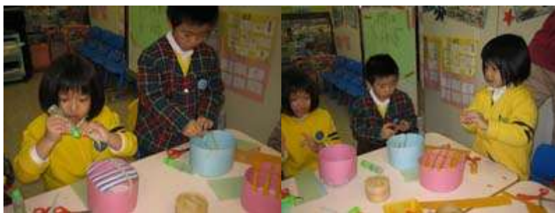
图 11-12: 准备蒸笼