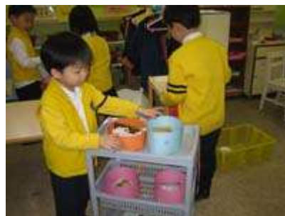
图 16: 运送点心