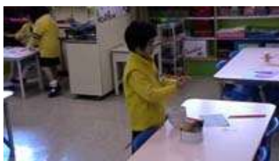
图 21：女服务员在清理桌子