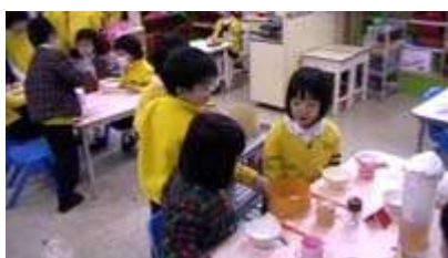
图 17: 给客人上点心