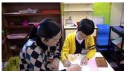
图 19: 教师和收银员在检查计算结果

收银员需要计算出餐点的总价并且以相对较快的速度为客人找回零钱，因为许多客人急等着要离开。