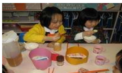
图 18: 享受食物

收银员需要计算出餐点的总价并且以相对较快的速度为客人找回零钱，因为许多客人急等着要离开。