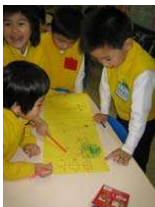
图 8：讨论餐馆的名字

厨师小组和点心服务组的全体成员负责准备食物。厨师们决定供应四种类型的点心（春卷、蒸叉包、馄饨饺子和蒸萝卜糕），这样他们就可以提前准备食物了。他们用废旧纸张来做点心的订单卡片，也用纸来给顾客们准备食物，有的儿童从广告纸上剪下有点心的照片，有的则是自己画出不同类型的点心。