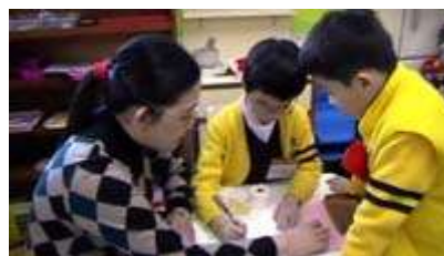
图 20: 服务员把账单和钱送到收银处

作为大幸福餐馆的一名服务员或收银员需要面临解决数学问题的任务，下面是教师和一名收银员与服务员的对话：