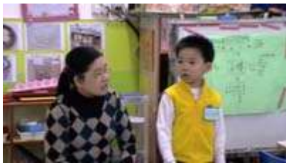
图 23: 一个厨师在分享他的经验

明:是的,当发现问题之后,在服务员给我们送来单子时我们会核查所有的细节,如果他们忘记了,我们会请他们返回去写上准确的桌子编号,这样问题就解决了。