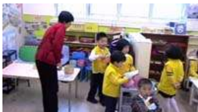
图 15: 厨师和点心服务人员在做准备