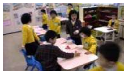
图 14: 女服务员将客人引向餐桌