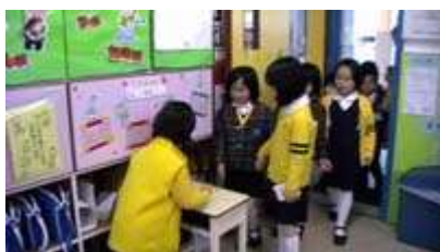
图 13: 女老板在记录预约

重要的开张日终于来到了, 儿童对他们自己的餐馆感到非常兴奋。后面仍有许多工作要做, 他们决定把人分为三个小组: (1) 顾客 (2) 服务员和 (3) 厨师及点心服务队、女老板、收银员。三个小组每天都会轮换, 以确保每个人在四天的餐馆游戏日中都能体验不同的角色。服务员需要摆桌子, 包括摆放筷子、碗, 并为每个桌子贴号码牌。为了能够更快地地上菜, 三个厨师提前准备和组织了食物。当客人到来的时候, 女老板先问候他们, 接着客人就被迎进了干净而舒适的餐馆。