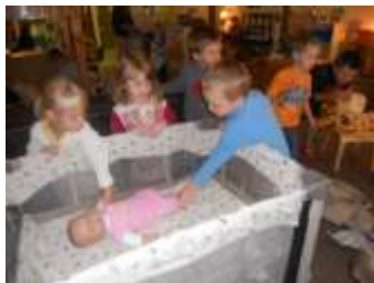
图52.幼儿在组装好的摇篮里放了一个娃娃。