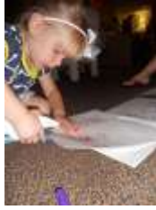
图15.将书页装订在一起。