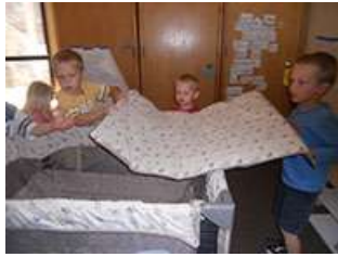
图51.幼儿一起合作将床垫摆好。