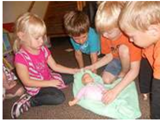
图54. 幼儿在指导一个练习包裹婴儿的同伴。

由于整个班级都和教师们在一起准备结束阶段的汇报工作，我们开始在小组会议中讨论如何开展这项活动。幼儿很关注可能出错的东西。一个幼儿说，来访老师可能不知道我们班幼儿的名字。另一个幼儿说她担心会忘记自己的工作。有一个幼儿建议可以用小的空白粘纸写上大家的名字和工作，然后在结束汇报时贴在身上。另一个幼儿觉得这个方法很完美，因为“老师们都认识字。我知道你的名字，不过如果我忘记你的工作了，我可以请其他人帮助我读出你要做的事情。”