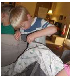
图50.组装摇篮需要关注细节。