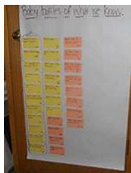
图4. 在老师的帮助下，孩子们列出他们对主题现有的认知。

树的照片可能就是整个网络图的中心。在我们这个活动中，我们采取了另一种方式。有人向班级捐赠了彩色卡片，孩子们很喜欢用它。因此，我们用卡片来制作一份清单，列出他们已有的知识经验，而不是制作网络图。老师们帮孩子们列出他们对主题现有的认知，把每个孩子的陈述记录在卡片上并标上孩子的姓。为了增加视觉上的趣味性，老师们把每列清单都勾勒出婴儿奶瓶的轮廓（图4）。