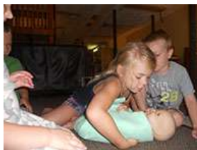
图44.第五步：将另一个角折叠起来。