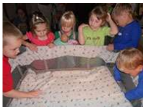
图63.孩子们最后将装饰品装到 Pack ‘n Play 上。

在婴儿项目的最后环节，孩子们列出了一份学习清单，他们把自己在这个项目中所学到的东西都列了上去。然后，他们将这份清单放在通向教室的走廊里，这样家长和客人就能看见他们学到了很多东西：