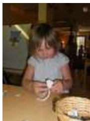
图19.斯嘉丽在制作一个摇铃。