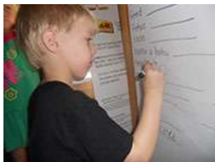
图53.在收尾阶段， 幼儿签名选择具体的角色。

幼儿与教师一起进行了一场讨论，幼儿 想要把他们在蜜蜂班（0—2岁）和瓢虫班（2岁）学到的有关婴儿的知识与老师一起分享。然后，他们口述了一份清单，清单上是一系列需要在分享环节做的重要的工作。清单完成之后，他们问我是否能帮他们做一份报名单，因为他们都想报名参加角色扮演，以向来访者展示。