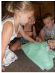
图43.折叠底部的毛毯。