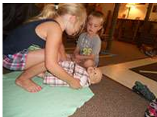
图41.第二步：将“婴儿”放到毛毯上。