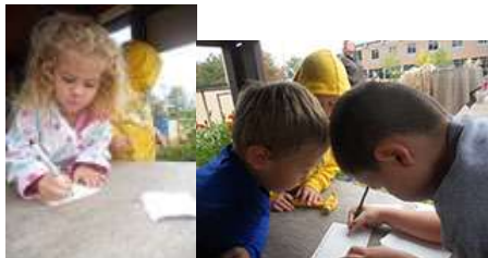
图55-57.幼儿在户外书写。