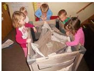
图49.幼儿共同合作组装摇篮。