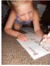
图16. 插画是婴儿书的重要组成部分。