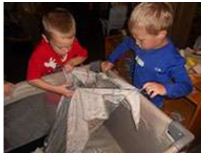
图62.孩子们合作为客人组装 Pack ‘n Play 。

在客人离开之前，孩子们想展示一下他们组装 Pack ‘n Play 有多么厉害。他们能够在20分钟以内组装完成，而在他们第一次试图组装它时要花近40分钟（图62&63）。在角色游戏时，他们遇到了困难：侧面装不进去。一个幼儿通过参考说明书，并指导我来帮助他们完成任务，解决了这个问题。